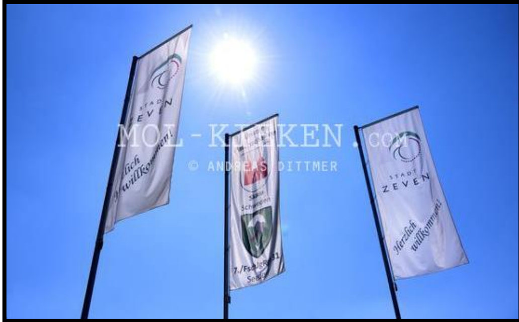
Abbildung 2: Beispiel für Fahnenmasten

Fahnenmasten an den Ortseingängen: Neben den Willkommensschildern wurde angeregt auch Fahnenmasten an den Ortseingängen aufzustellen. Diese könnten ebenso dafür genutzt werden Veranstaltungen zu bewerben. Zwischen zwei Masten können auch Banner aufgehängt werden. (vgl. Abbildung 2 und Abbildung 3 )