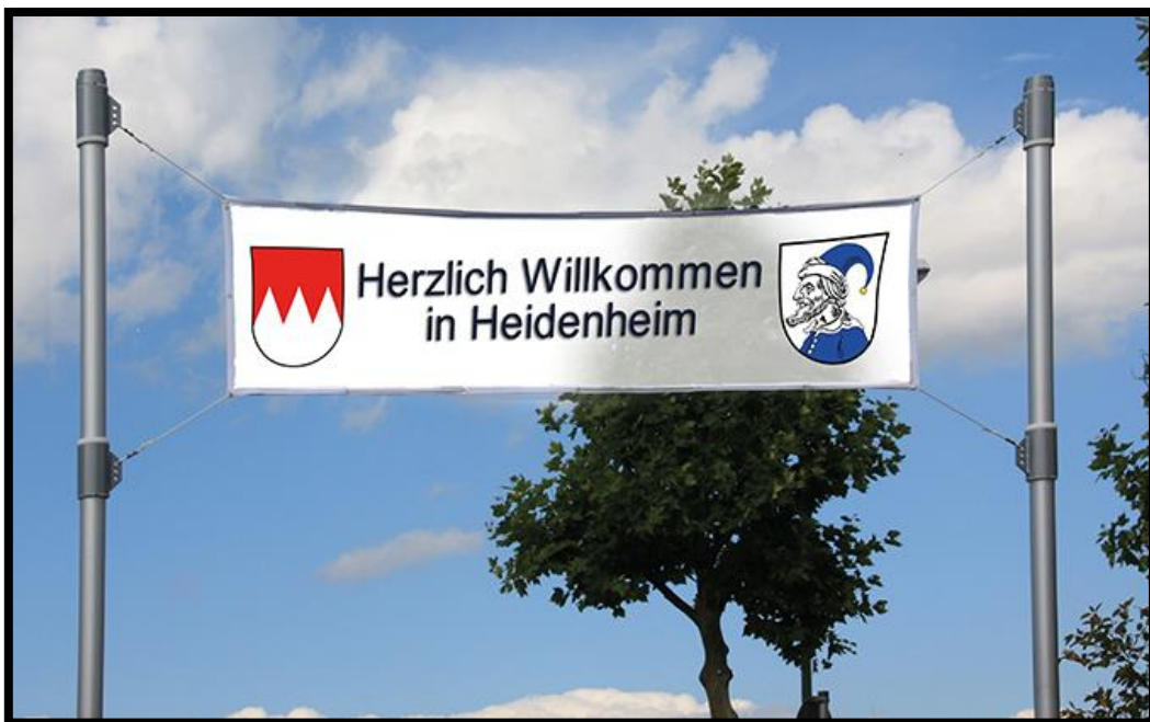
Abbildung 3: Beispiel für ein Banner; Quelle: https://www.google.com/imgres?imgurl=https%3A%2F%2Fwww.kommunaldirekt.de%2Fwp-content%2Fuploads%2F2018%2F08%2Fkd184_neumeyer.jpg&imgrefurl=https%3A%2F%2Fwww.kommunaldirekt.de%2Fvorlageh1-ausgabenbeitrag-master-39-16%2F&