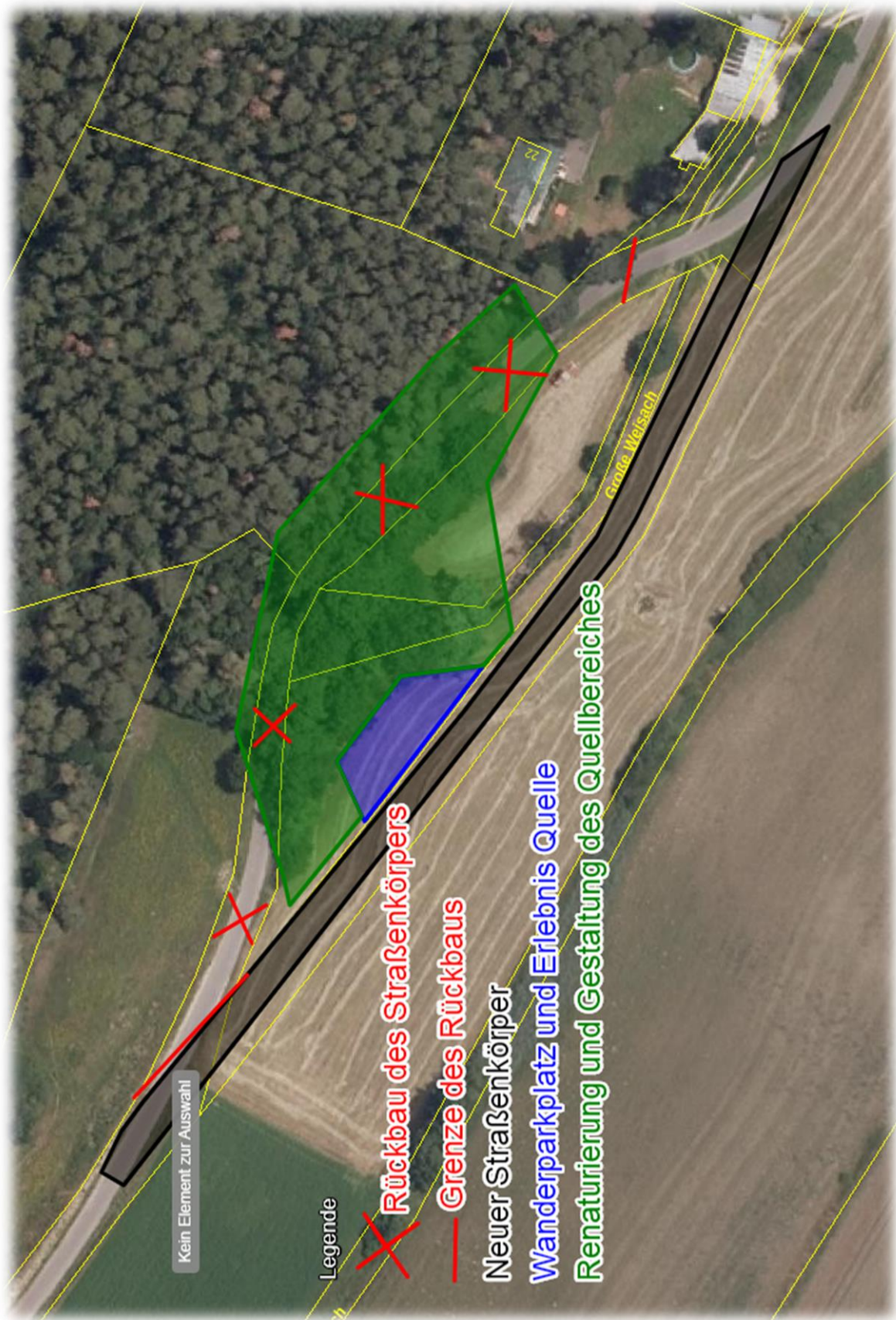
Abbildung 6: Umgestaltung des Quellbereiches; Kartengrundlage: © Daten:geoportal.bayern.de, Bayerische Vermessungsverwaltung, EuroGeographics