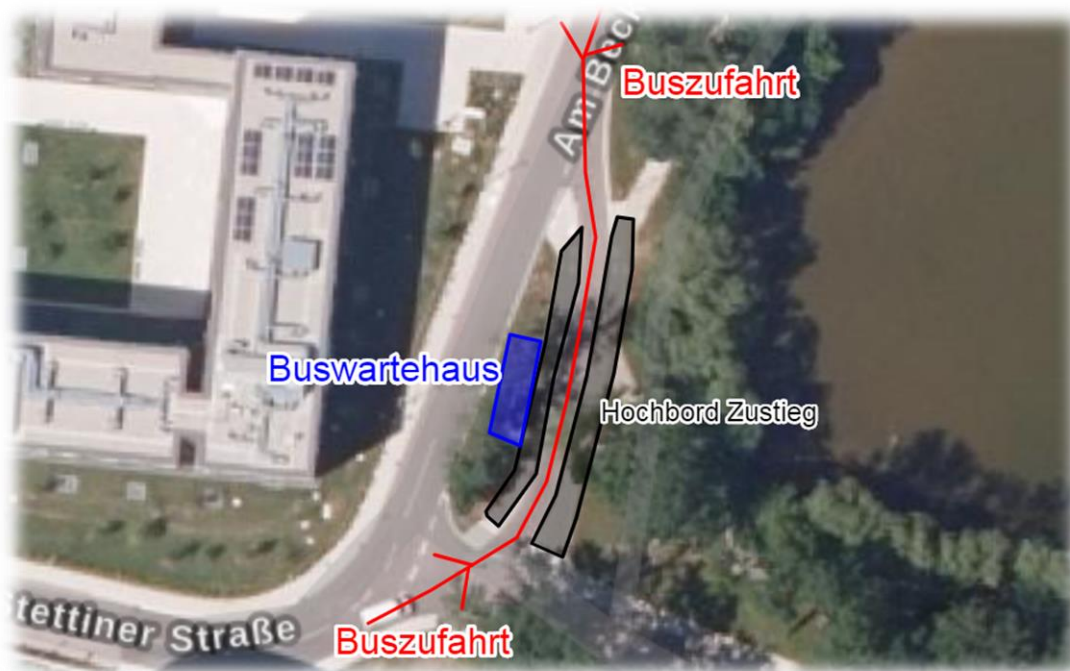
Abbildung 4: Bushaltestelle mit beidseitigem barrierefreien Einstieg in Ansbach an der Landesfinanzschule

Standort der Bushaltestelle: Der Standort und Zustieg für den Bus sind in Altershausen schon mehrfach diskutiert und schließlich geändert worden. Es gibt aktuell zwei Zustiegsmöglichkeiten, wovon keine den Zustieg von beiden Straßenseiten aus ermöglicht. Es wurde darüber gesprochen, dass eine Bushaltestelle mit beidseitiger Einstiegsmöglichkeit geschaffen wird. Somit können die Reisenden alle Bustouren an einem Platz nutzen. Der Wegfall der aktuellen Bushaltestelle inklusive Bucht würde neuen Raum für die Gestaltung des Bolzplatzes in diesem Bereich bedeuten. Die ersten Überlegungen zur neuen Bushaltestelle beziehen sich auf den Bereich des aktuellen Container- und Parkplatzes am Bolzplatz. Dort könnte eine Bushaltestelle wie in Ansbach realisiert werden. (vgl. Abbildung 4). Die Reisenden können barrierefrei an beiden Seiten zusteigen und der Bus kann von beiden Seiten in die Bucht fahren. Der Umgriff um das Buswartehaus soll grün gestaltet werden. Dies kann in der Gesamtplanung des Bolzplatzes geschehen, sodass sich diese Funktion nahtlos in die Umgebung einfügt. (vgl. Abbildung 5)