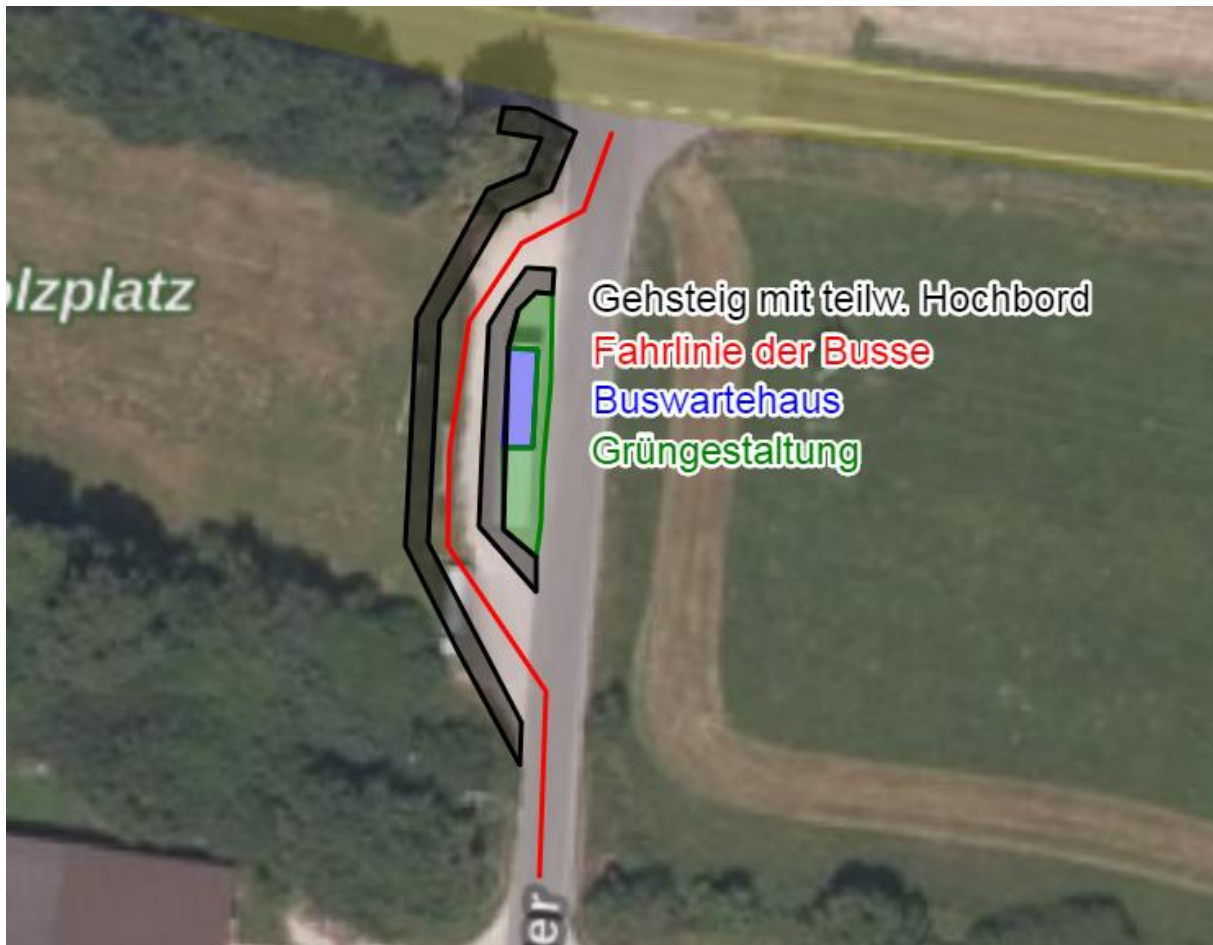
Abbildung 5: Skizze für die Gestaltung des beidseitig begehbaren Buswartebereich im Bereich des Container- und Parkplatzes. Die Darstellung der farbigen Elemente ist nicht maßstäblich!; Quelle: © Daten:geoportal.bayern.de, Bayerische Vermessungsverwaltung;

Restaurierung und Renaturierung der Quelle in Altershausen: Die Quelle der Großen Weisach ist seit jeher Lebensspender in Altershausen. Sie versorgt den Ort unermüdlich mit schmackhaftem Wasser hervorragender Qualität (nur leider etwas kalkhaltig). Leider ist die Verkehrssituation in diesem Bereich äußerst unüberschaubar. Die Quelle ist von einem Waldstück eingefasst, in das von beiden Seiten eingefahren wird. Der Wechsel der Lichtverhältnisse beeinträchtigt die Verkehrssicherheit. Gerade in den sonnigen Sonnenmonaten haben die Augen keine Möglichkeit sich so schnell an die äußerst schattigen Verhältnisse im Quellwald zu gewöhnen. Verschärft wird diese Situation durch die doppelte Kurvensituation an beiden Fahrtrichtungen aus dem Wald. Beide Kurven sind an der Seite stark eingewachsen, sodass die Sichtverhältnisse als schlecht zu bezeichnen sind. Der Zustand der Fahrbahn ist aufgrund der Löcher und Flicker ebenso als schlecht zu bezeichnen. Die Lebensdauer des Straßenkörpers nähert sich dem Ende. Die Quelle liegt zudem in einem Trinkwasserschutzgebiet. Der aktuelle Straßenverlauf erfolgt erhöht über der Quelle und an der Quelle über die Große Weisach. Im Falle eines Unglücks aufgrund der schlechten Verkehrssituation könnte die Quelle beschädigt oder/und verunreinigt werden. In diesem Falle wäre die Wasserversorgung von Altershausen zeitweise oder im schlimmsten Falle für immer außer Betrieb. Aktuell